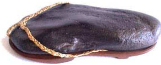
Đá có dạng Bàn chân (Kern River – CA – USA)

Loại đá có những hình ảnh trên bề mặt (Mon'yo Seki - Pattern Stone). Thực vật: như hoa, cây, lá, cỏ... Thiên hà: như mặt trời, mặt trăng, sao... Thời tiết: Mưa, sấm sét, tuyết... Trừu tượng: như Rồng, rắn, vằn da cạp... (4)