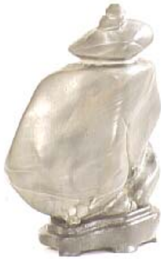
Đá Nhân dạng (Human-shaped Stone) Ý.