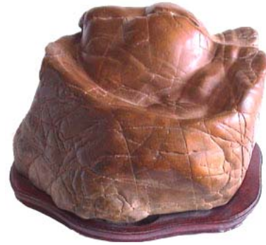
Đá có dạng Nén Vàng (China)

Loại đá có những hình ảnh trên bề mặt (Mon'yo Seki - Pattern Stone). Thực vật: như hoa, cây, lá, cỏ... Thiên hà: như mặt trời, mặt trăng, sao... Thời tiết: Mưa, sấm sét, tuyết... Trừu tượng: như Rồng, rắn, vằn da cạp... (4)