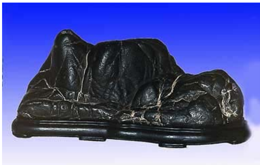
(Keiseki Hirotsu's collection - USA)

trông như thác nước đổ từ trên cao xuống (Taki Ishi - Waterfall Stone)