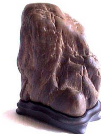
(Petrified Wood - CA- USA)

Biệt Đảo: Đá có dạng đảo ở biển (Shimagata Ishi - Island Sone)