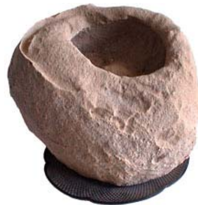
(Yuha desert - CA-USA)