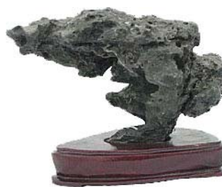
(Ying Rock - China)

Dương Đông: Đá có dạng mũi nhô ra biển (Amazadori Ishi - Shelter Stone)