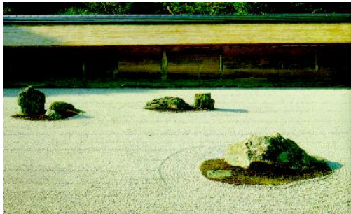
Thiền viện Ryōan-ji (Kyoto-Japan)

niệm về ‘Viên Lâm Vi Hình’ tức là Vườn thu nhỏ - trong đó Đá, Cây, Nước là những thành phần chính - Nghệ thuật Non Bộ của VN cũng bắt nguồn từ đây, được định nghĩa như là núi giả (Giả Sơn) để làm cảnh trong sân, hoặc trên bể cạn. Người ta đem cái đẹp, cái hùng vĩ của sơn thủy thu gọn lại trong không gian nhỏ bé ở một góc vườn nhà, hay nơi khuôn viên Thiền viện và qua đó gợi cảm tình cảm sâu lắng mang nội dung triết học bao la.