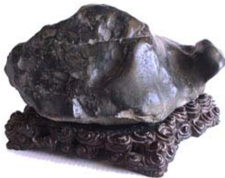
Đá có dạng Quy Thân (Eel River – CA – USA)

Gần đây, chúng ta thấy xuất hiện nhiều, loại đá Pattern Stones có hình hoa Cúc (Chrysanthemum Stone) nhập cảng từ Trung Hoa, được bày bán nhiều trong những lần triển lãm cây, đá kiểng ở địa phương, mặt đá mài nhẵn và được thổi lên một lớp dầu nhân tạo bóng lưỡng, đôi khi còn bị cưa ngang để tạo mặt bằng, loại đá này gọi là Biseki - nghĩa là Mỹ Thạch (đá đẹp) mà thôi, không được xếp vào hạng Thủy Thạch giá trị.