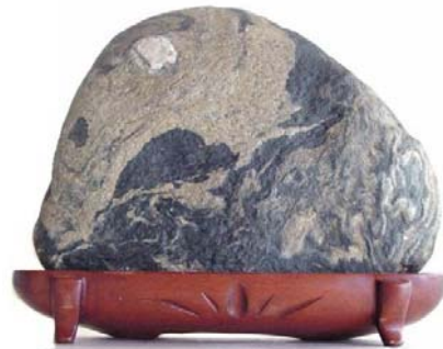
Đá có hình mặt trăng (Japan)