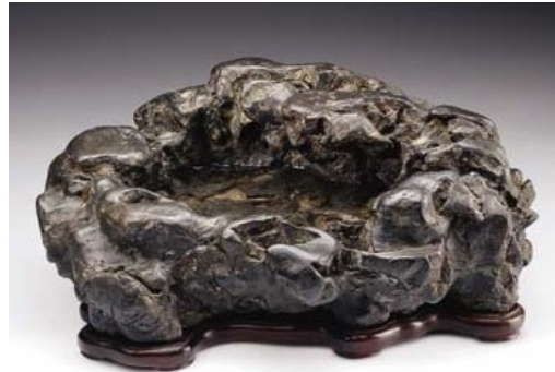
(Eel River- CA-USA)

Địa Bồn: Đá có dạng bồn chứa nước (Mizutamari Ishi - Waterpool Stone)